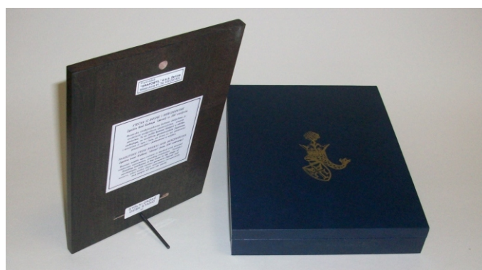
Pakovanje u različite ambalaže

“STARI GRAD VRANDUK” – Vrandučka tvrđava je predstavljena suvenirom od reljefa u bakru, na maloj drvenoj pločici dimenzija 150 x 110 mm. To je reprodukcija grafike poznatog bosansko hercegovačkog slikara Tomislava Perazića. Na poleđini suvenira je ispisan tekst na našem i engleskom jeziku o povjesnoj ulozi i značaju ove tvrđave.