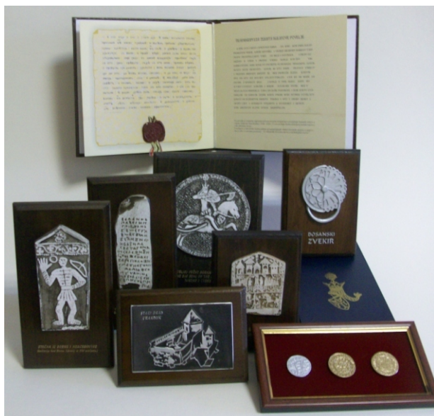
Jedan dio kolekcije suvenira «Znakovlje srednjovjekovne Bosne»

U ovom ciklusu treba izdvojiti i povjesni dokument “Akt abjuracije Bosanskog bana Kulina” (po jednom nazivu) ili “Ispovjest bosanskih krstjana” (po drugom nazivu). Uz reprodukciju izvornog dokumenta , u ukrasnom tvrdom povezu ( dupli A4 format), nalazi se prevod na hrvatski/bosanski i latinski jezik.