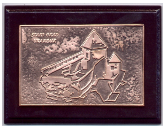
Stari grad Vranduk ( reljef na bakru i posrebrenom limu) - pakovanje u kartonsku kutiju